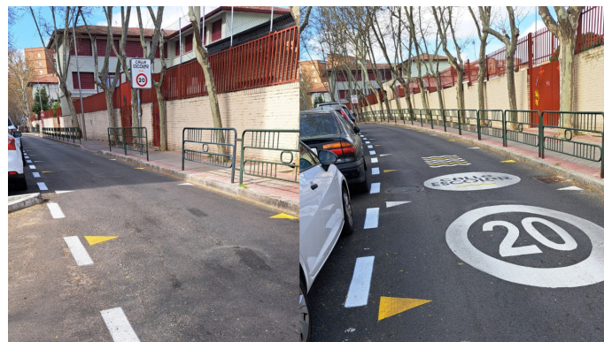
Nueva señalización en entornos de colegios y escuelas infantiles

Se ha mejorado la señalización vertical y horizontal en las