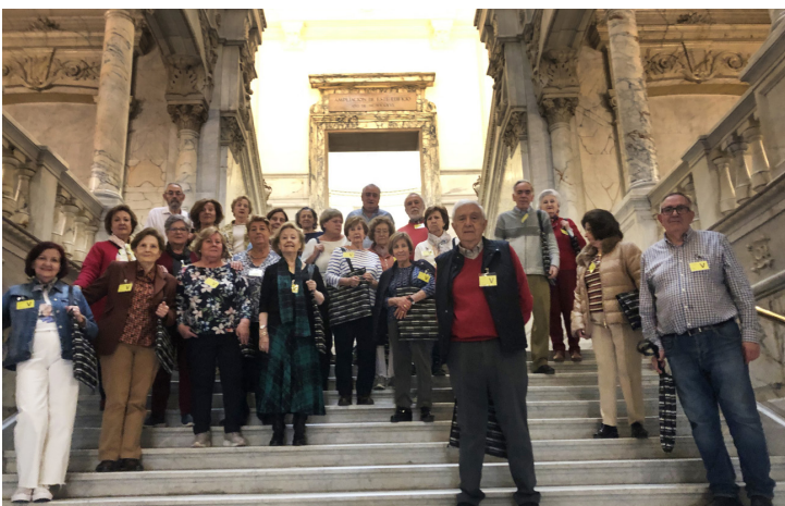
Imagen del Grupo en la visita al Banco de España en la escalera principal

El Banco tiene previsto inaugurar una exposición permanente de toda su pinacoteca, la mayoría perteneciente a Goya, aunque también podemos contemplar obras de Mariano Salvador, Maella, Vicente López o Federico Ma-