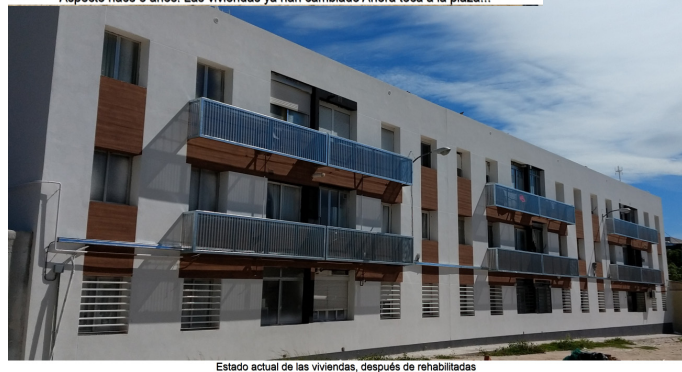
Estado actual de las viviendas, después de rehabilitadas

la Empresa Municipal de la Vivienda y suelo (EMVS). Su presupuesto es