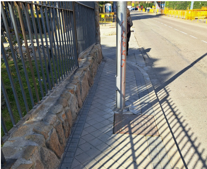
Farola al comienzo de c/ Aguilar Muñoz que ha sido eliminada

Prácticamente están terminadas las obras de remodelación de esta calle, en el tramo Paseo de la Alameda – Rioja. A pesar de que la calle resulta estrecha para el tráfico