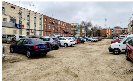
Aspecto hace 3 años. Las viviendas ya han cambiado Ahora toca a la plaza!!!

El 4 de abril, el Ayuntamiento ha aprobado la urbanización del Barrio del Aeropuerto que será gestionada por